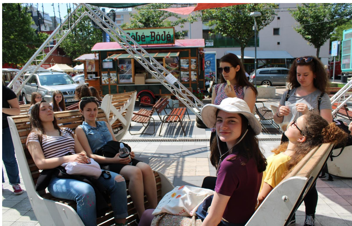
Zalaegerszegi városnézésen (2.)