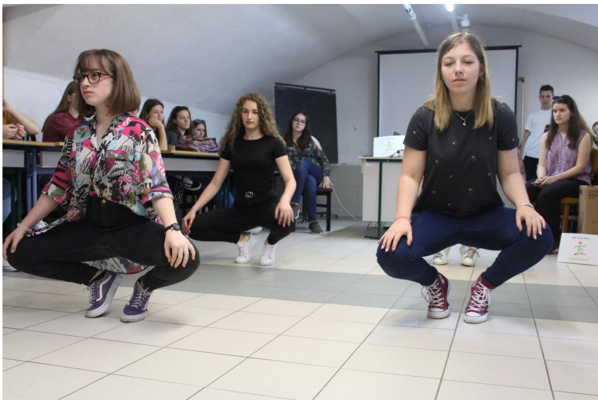
Kulturális műsor 2.