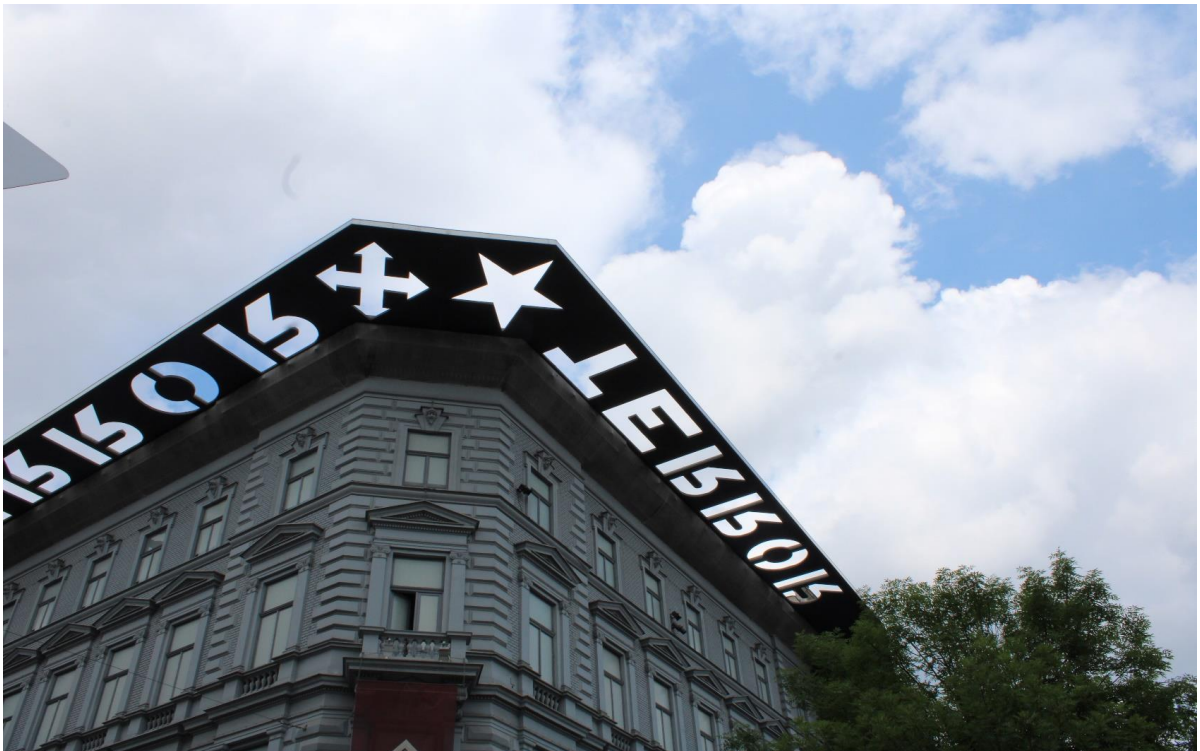
A Terror Háza Múzeumnál (2.)