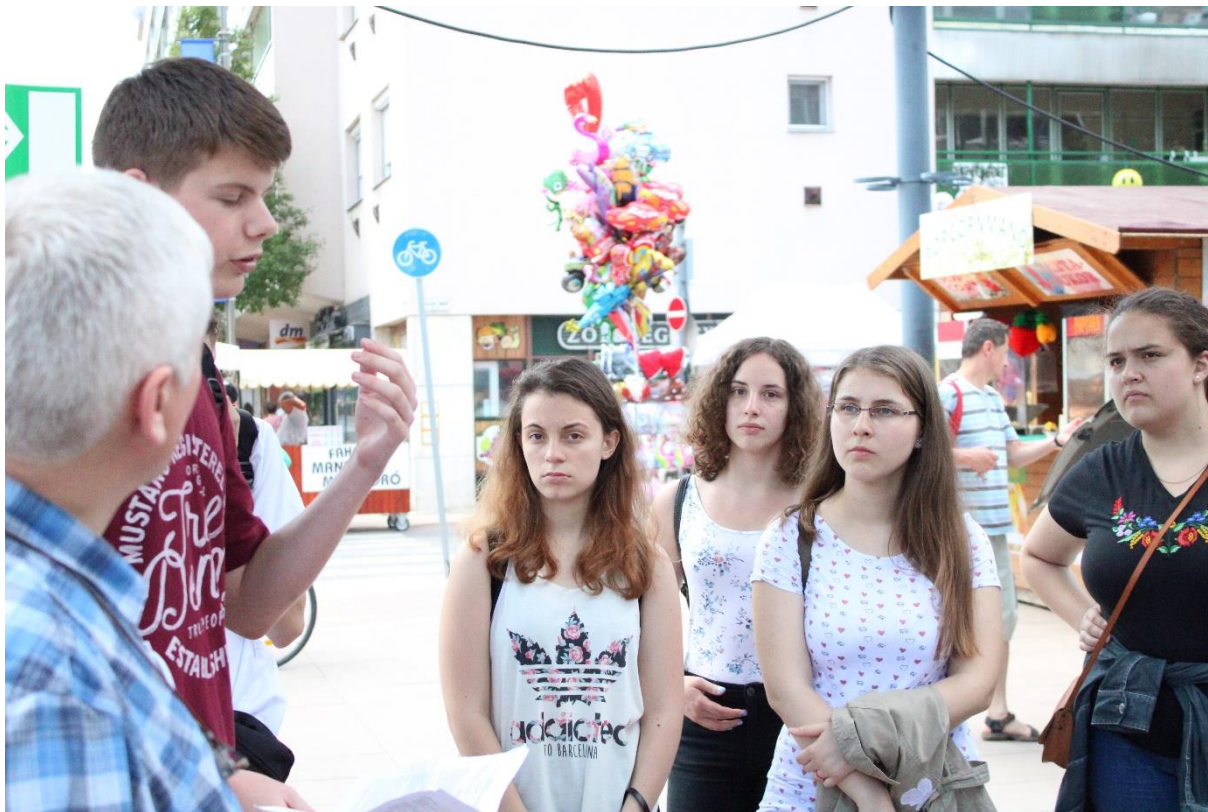
Zalaegerszegi városnézésen (1.)