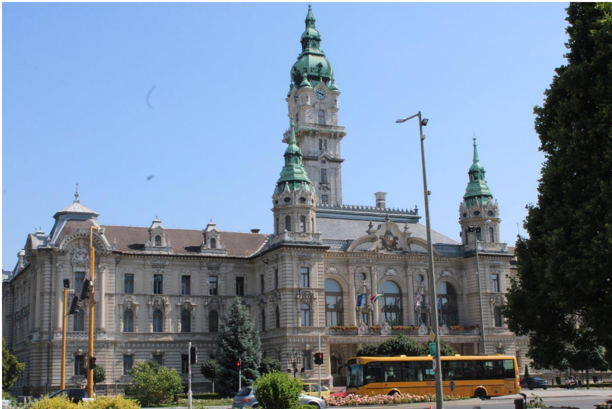
Győri városnézésen (1.)