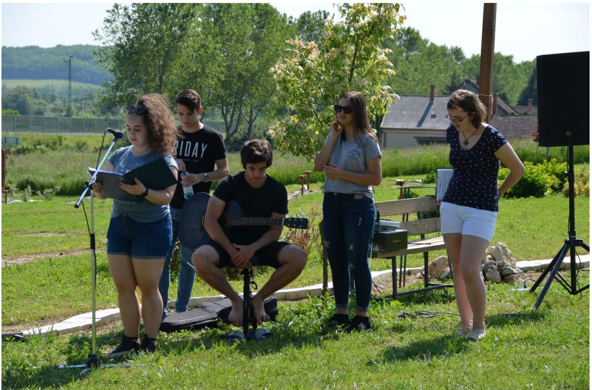
A nemzeti összetartozás napi megemlékezés főszereplői