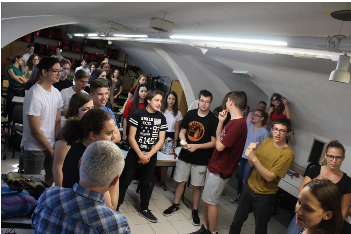
Együtt a két diákcsoport: közös beszélgetések