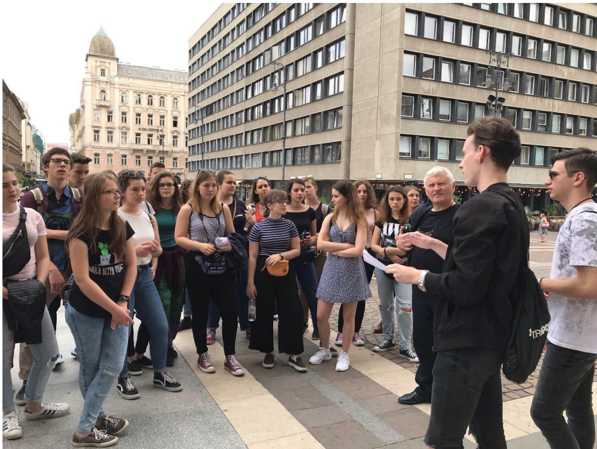
A Szent István Bazilika előtt