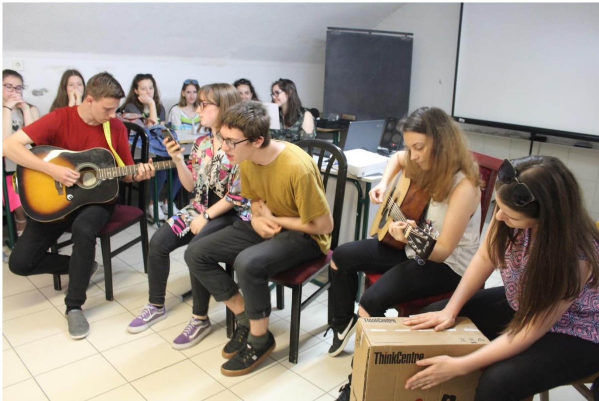
Kulturális műsor 1.