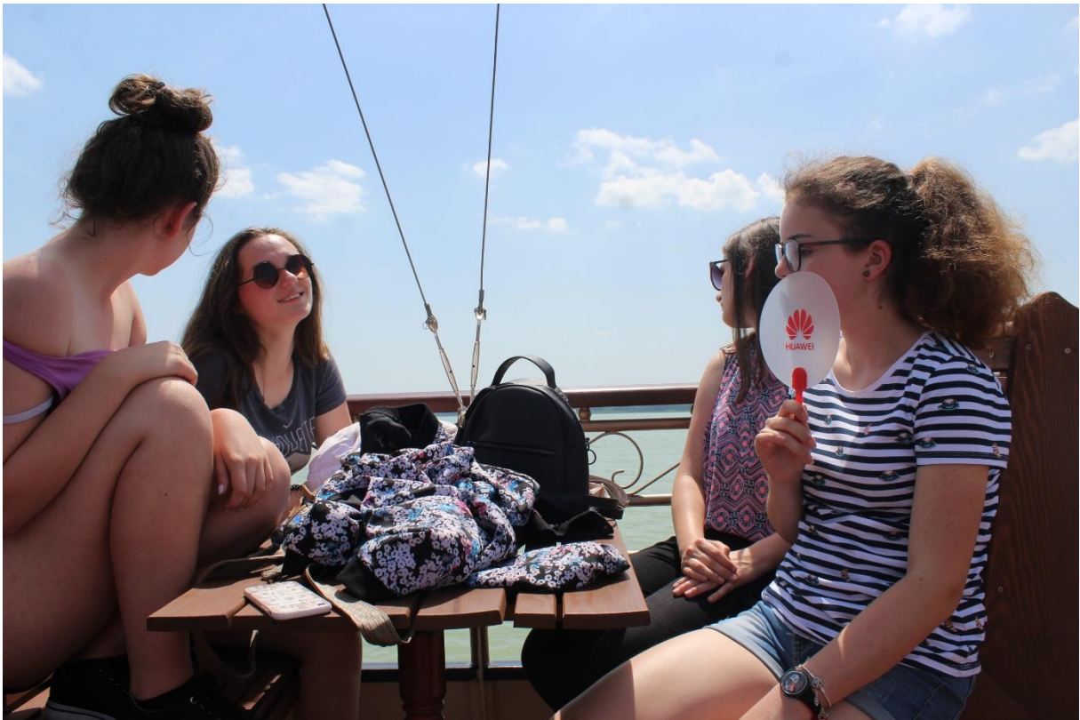
Gondtalan utazás, napfény, beszélgetés