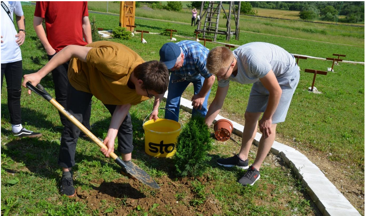
A közös tujaültetés a zalacsébi Trianon Parkban