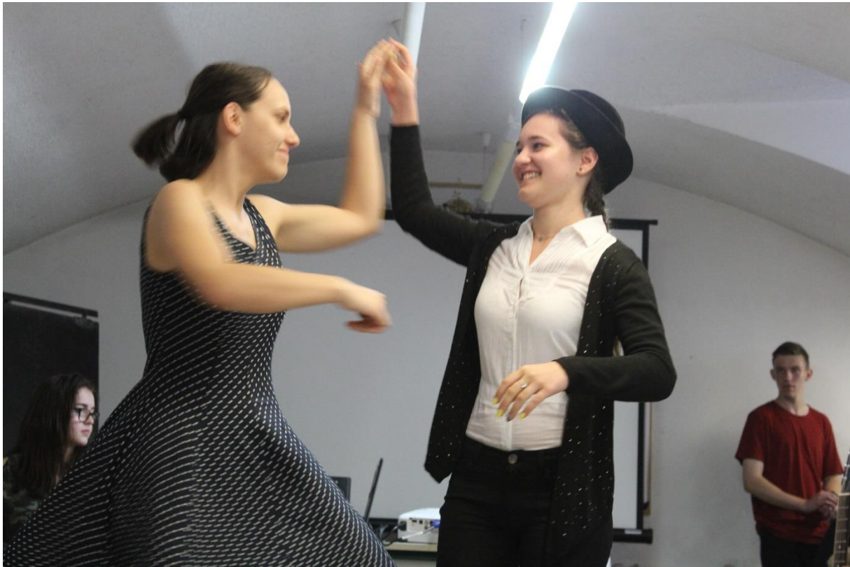
Kulturális műsor 3.