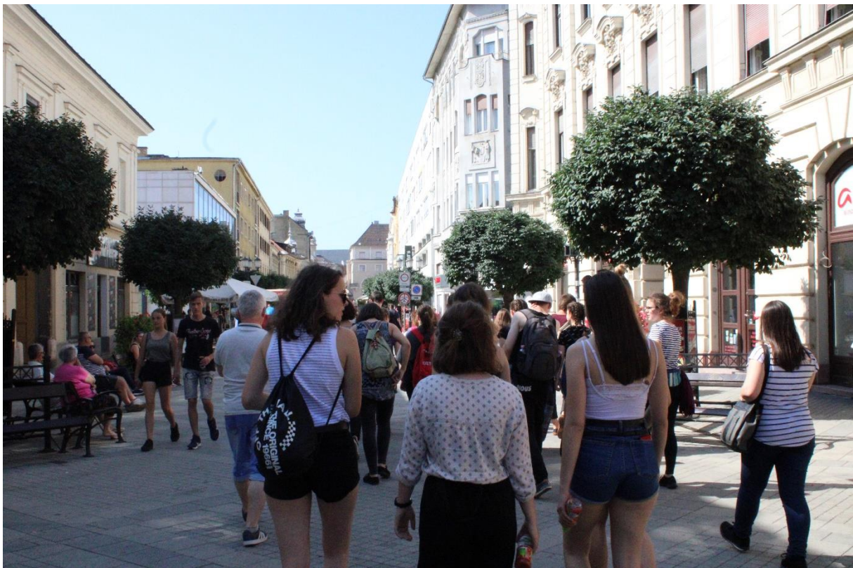
Győri városnézésen (2.)