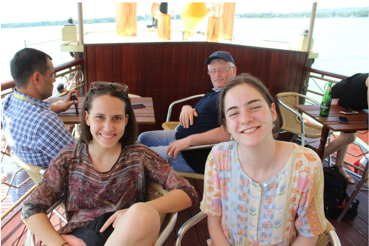
Boldogság és elégedettség