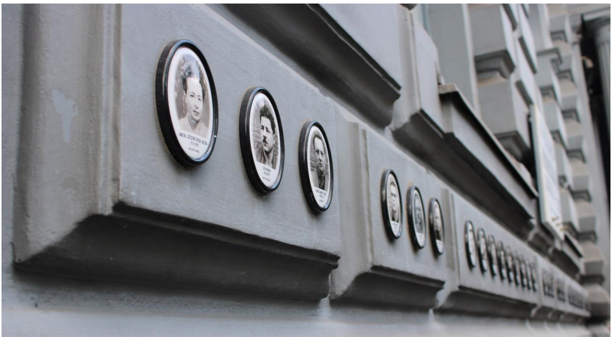
A Terror Háza Múzeumnál (2.)