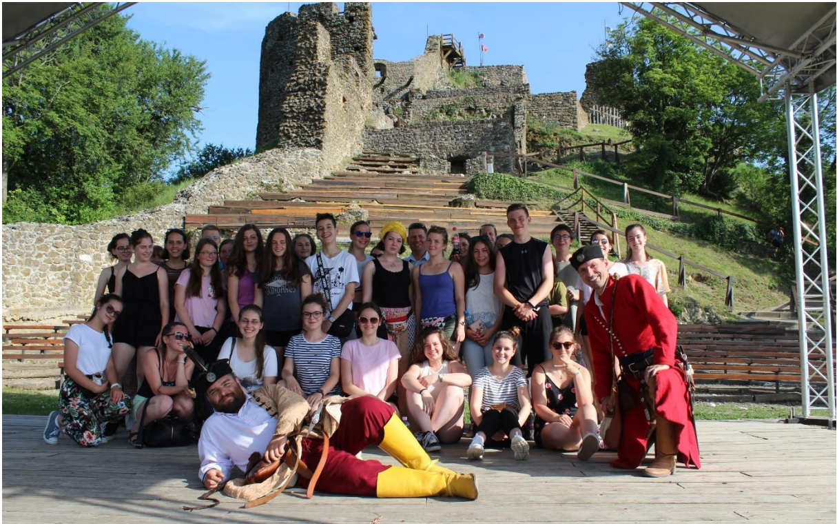
Erdélyi diákok a szigligeti várban