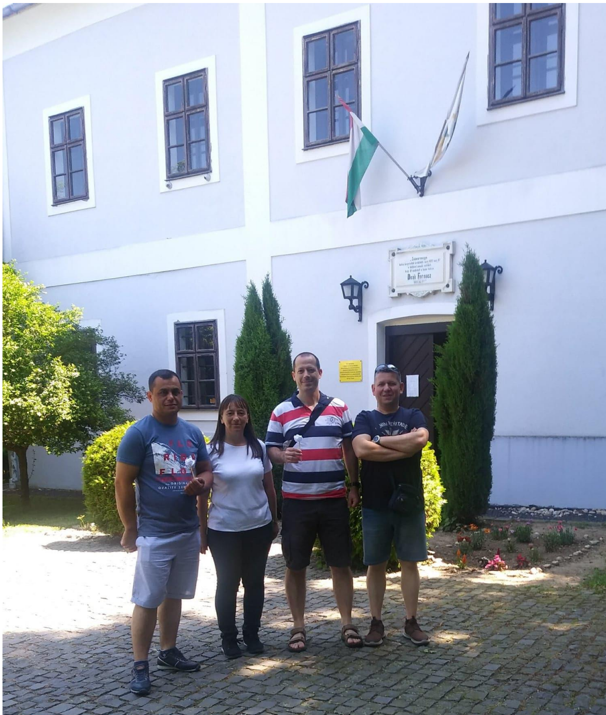
Söjtörön „a haza bölcse”, Deák Ferenc szülőházánál