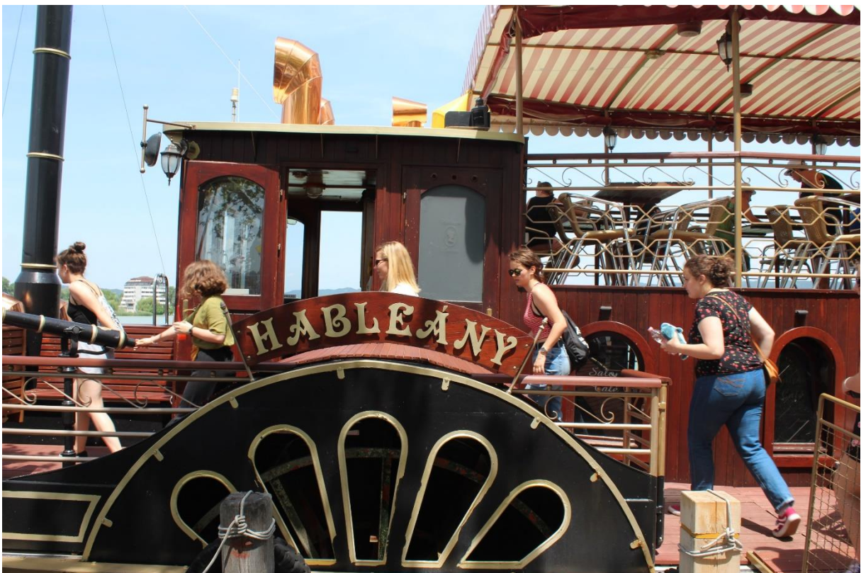
Felszállás a Hableányra a keszthelyi mólónál