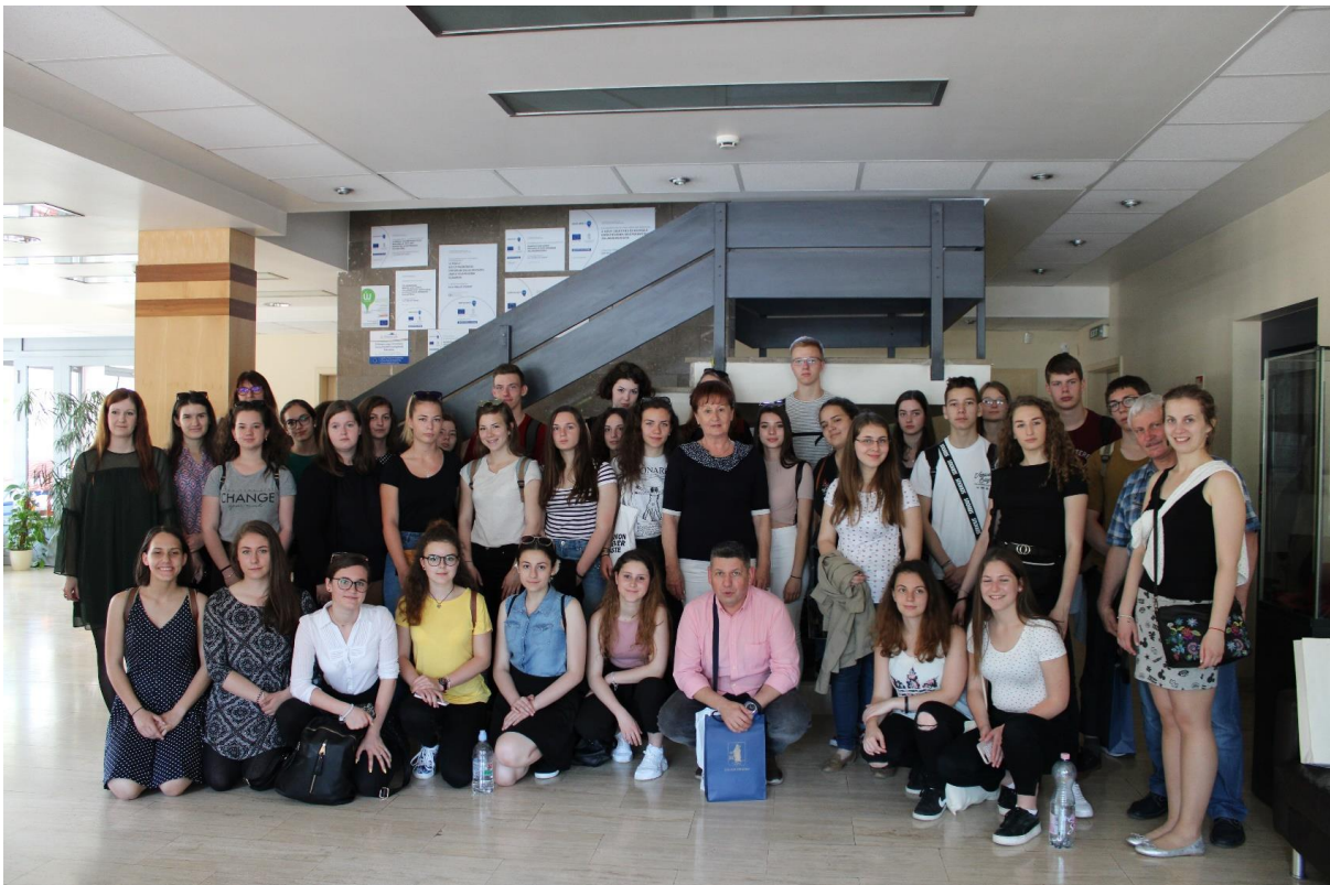
A polgármesteri hivatalban