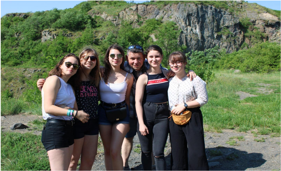
A Ság-hegyen (3.)