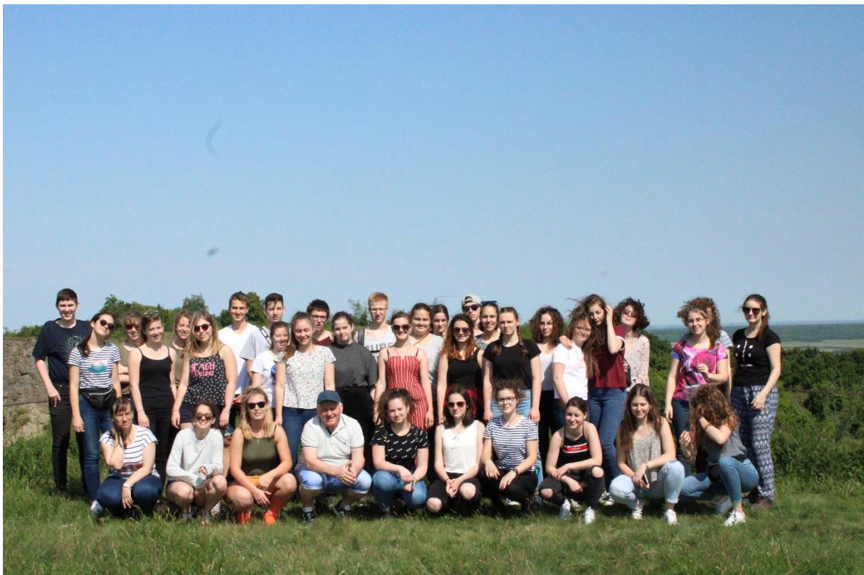
A Ság-hegyen (2.)