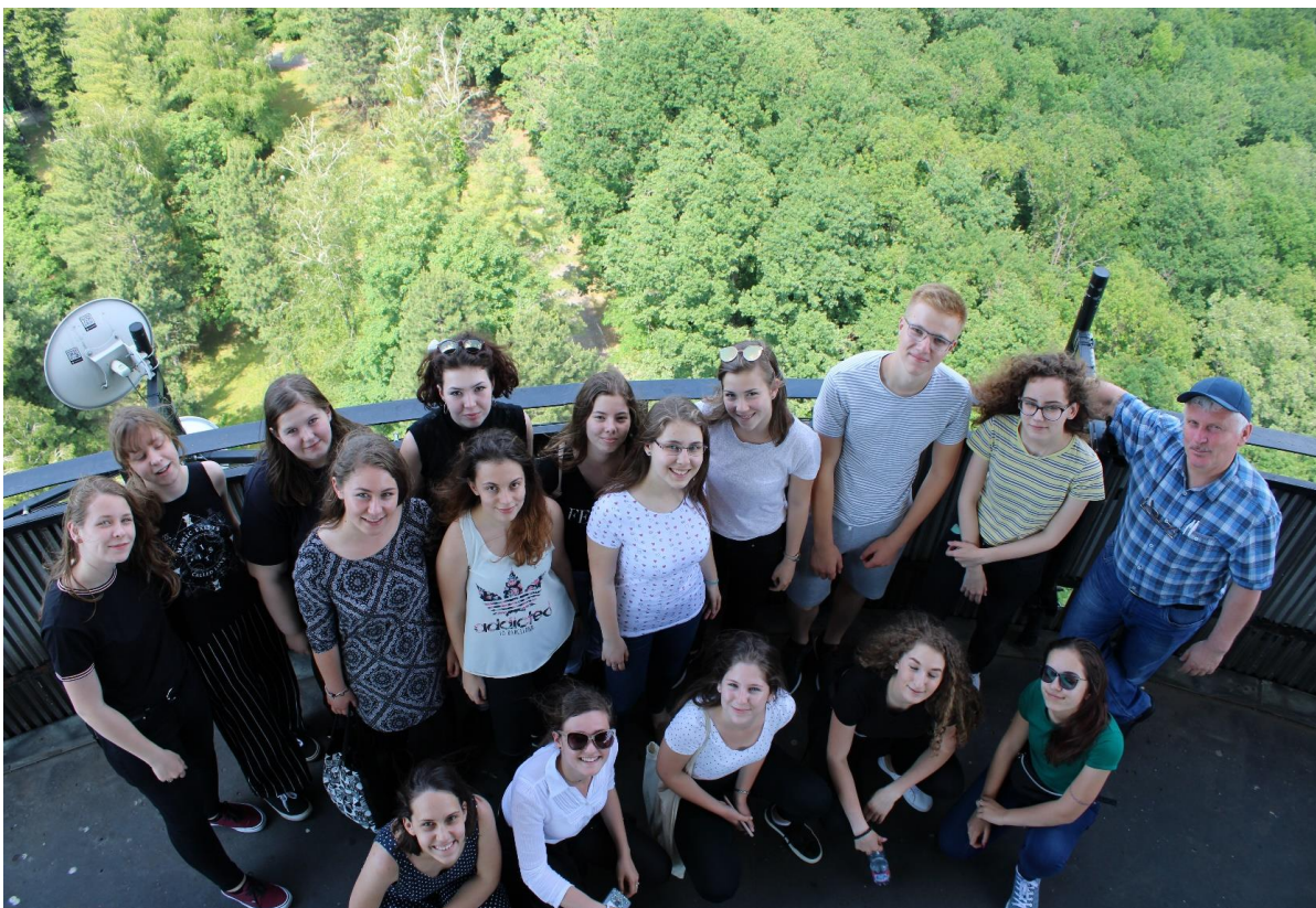
A zalaegerszegi TV-toronyban