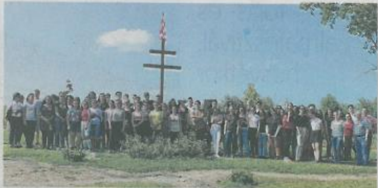
A diákok a zalacsébi Trianon Parkban

A szakmai előnyökben gazdag és a barátságokat eredményező gyümölcsöző testvériskolai kapcsolat keretében – a Határtalanul pályázat jóvoltából – 2019. június 5-e és 11-e között megyénkben töltött egy hetet a marosvásárhelyi Bolyai Liceum 10. évfolyamos diákcsoportja. A zalaegerszegi Zrínyi Miklós Gimnázium partnerintézményének tanulói többek