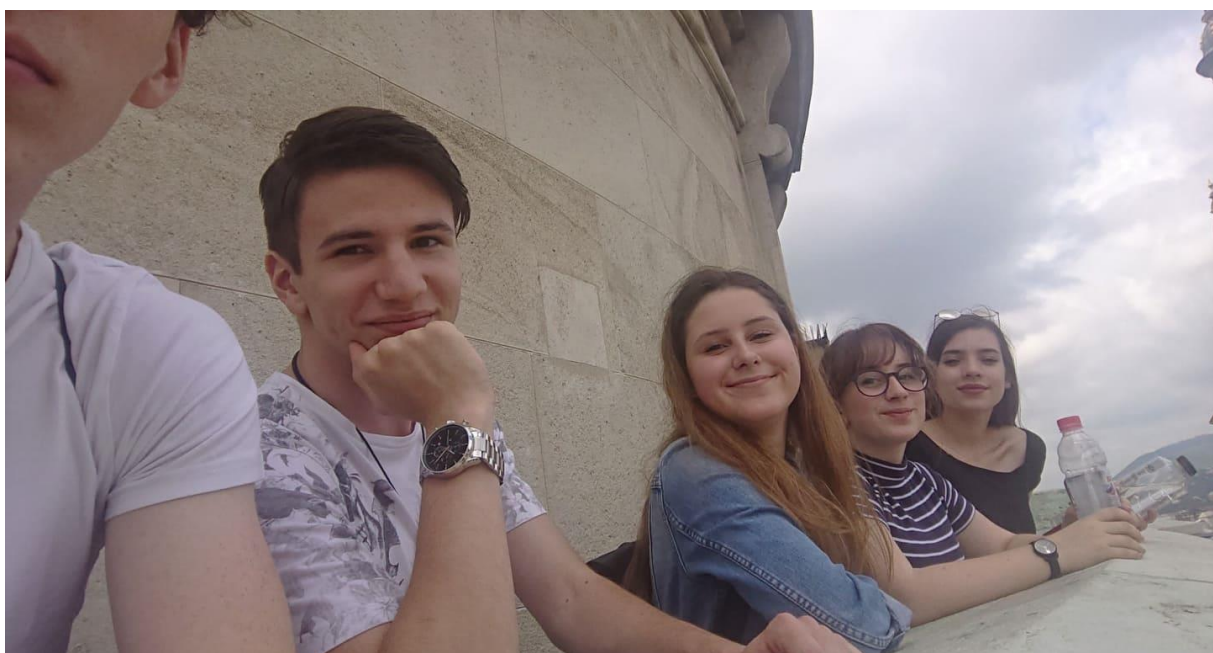
A Szent István Bazilika panorámakitérőjében