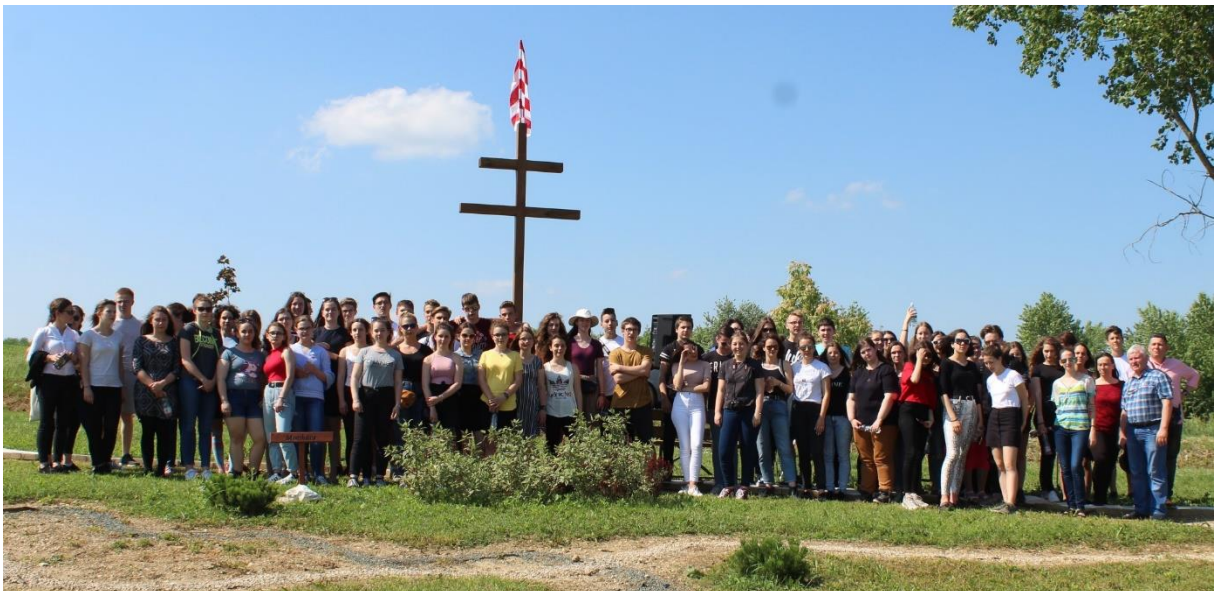
Együtt a két diákcsoport a Trianon Parkban