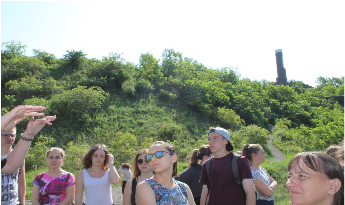
A Ság-hegyen (1.)